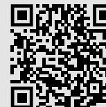
Nikki Beach Mallorca